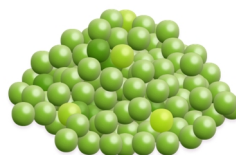
170 g de petits pois 10 g de fibres

Le choix des aliments dépend beaucoup de l'approvisionnement et des ressources financières, mais il est aussi fortement influencé par nos habitudes sociales, culturelles et religieuses. Et on ne peut pas non plus négliger que certains aliments consommés par les uns vont susciter le dégoût chez d'autres.