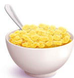
100 g de flocons d'avoine 10 g de fibres

Par exemple 10 grammes de fibres alimentaires sont contenus aussi bien dans 100 grammes de flocons d'avoine que dans 170 grammes de petits pois. Les équivalences permettent donc de manger de manière variée, tout en continuant à apporter les éléments essentiels à notre corps et en alternant les saveurs de nos repas.